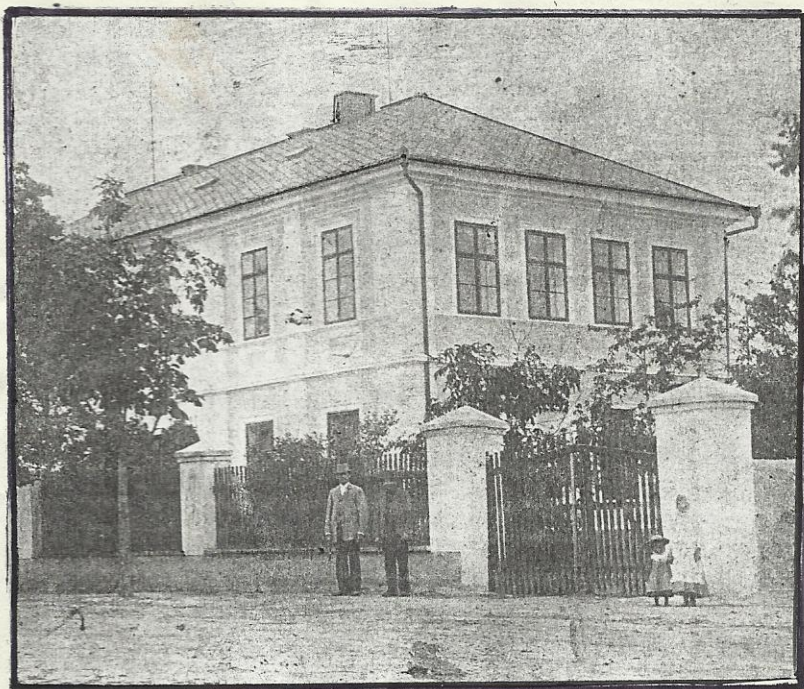
škola r. 1904

1880 nová školní budova dvojtřídní, která r. 1886 zrušením bytů byla upravena na trojtřídní. V roce 1904 byla provedena přístavba o čtvrtou třídu a byt řídicího učitele.