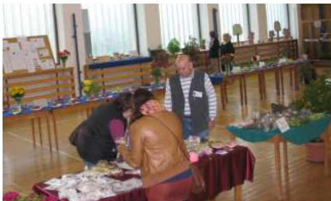
Hoby a zahrada