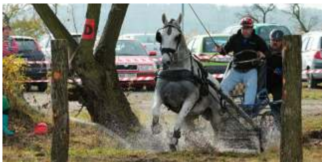
Závody ko ských sp ežení