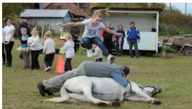
Gymnastika na koni