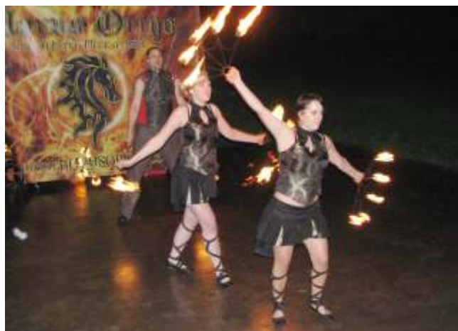
Ohnivá show Novous Origo