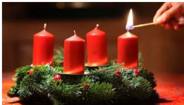
První ned le adventní