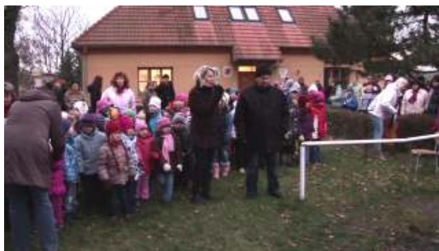
Rozsv cení váno ního stromu