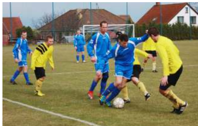
Zápas Krakovany - Jest ábí Lhota

Výsledkem tohoto všeho je 7. místo v tabulce se ziskem 14 bod z 10 zápas . I p es toto všechno je zde velká nad je pro budoucnost krakovanského fotbalu.