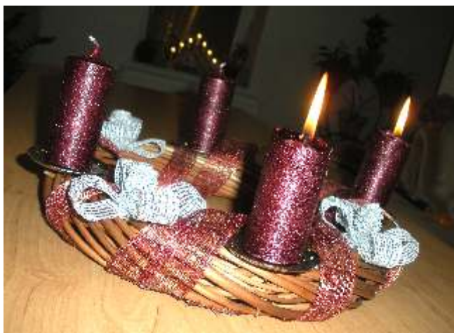
Adventní v nec svěpomocí