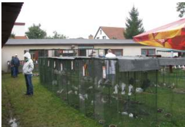
Hoby a zahrada

21. a 22. září 2013 na krakovanské posvícení se uskutečnila plánovaná tradiční výstava Hoby a zahrada v režii krakovanských zahrádkářů. Přestože bohužel letošní ročník poznamenala tragická událost v jedné z krakovanských rodin právě v sobotu, což se projevilo i na počet návštěvníků. Ti, kteří přišli, mohli co prohlédnout a i třeba se nám podařilo posílit všechny nahlédnutím do volných chvil sousedů, abychom tradičně žasli nad tím, jak mají šikovné ruce a chytré hlavy.