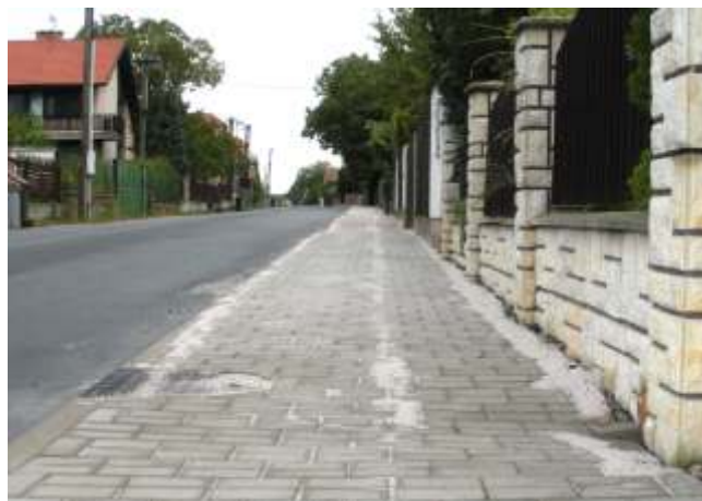
Nový chodník směrem na Božec

Oprava shora uvedených místních komunikací výrazně zlepšila dopravní obslužnost parkovacích lokalit.