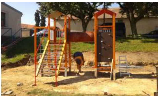
Rekonstrukce d tského h íšt

B hem zá í a íjna byla provedena rekonstrukce d tského h íšt . B hem rekonstrukce d tského h íšt byla ást herních prvk nahrazena novými a n které staré byly opraveny. Sou ástí rekonstrukce d tského h íšt bylo i provedení pom rn náro ných terénních úprav, které byly završeny osetím travního semene. Rekonstrukce d tského h íšt byla možná pouze díky pochopení spole nosti Agro Krakovany, která poskytla na nákup nových herních prvk ástku 100 000 K .