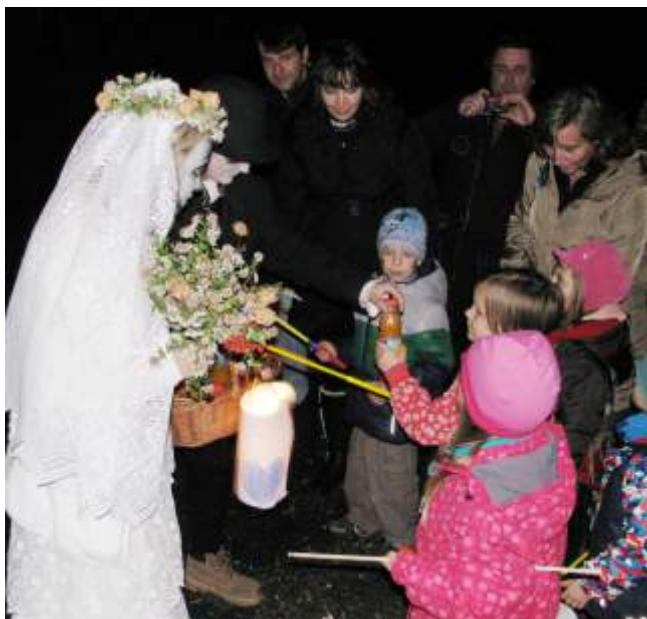
Lampionový pr vod