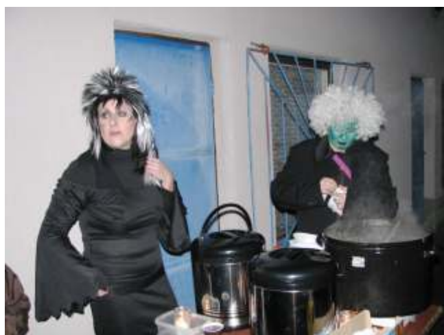
Lampionový pr vod

Letos se konal již t etí ro ník lampionového pr vodu obcí. Pr vod vycházel od základní školy ke h íšti sví kami osv tlenou cestou. Pokra oval k areálu kinolog kde se napojil na hlavní silnici , po které pokračoval k hasi árn . Dále prošel chaloupkami sm rem k hlavní silnici na Uhlí skou lhotu a okolo domu p. Kolínského a Jarešu zamí íl na h íšt . Zde na pr vod ekala cesti ka z vydlabaných a osv tlených dýní, která je zavedla k tane nímu parketu , kde bylo p ípraveno ob erstvení . Podávala se dý ová polévka , aj a sva ené víno.