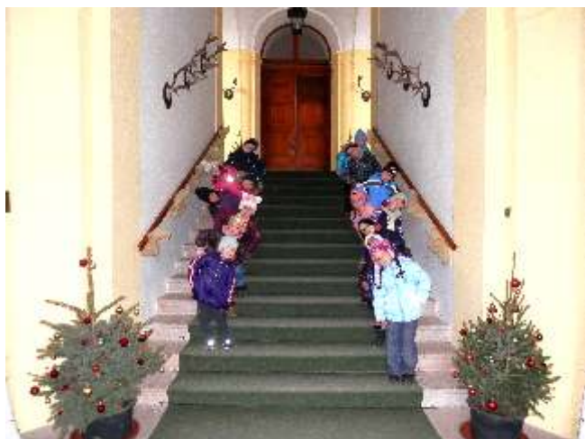
Zámek v Chlumci nad Cidlinou