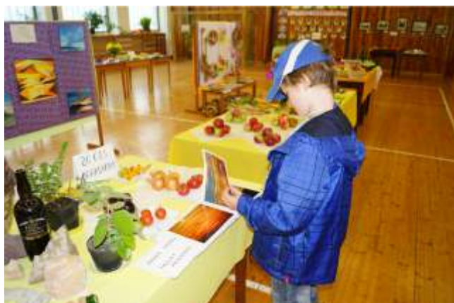
HOBBY A ZAHRADA 2015