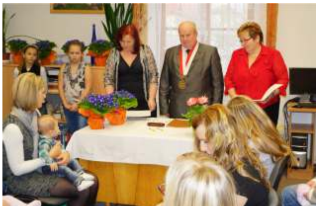
Vítání ob ěnk ů