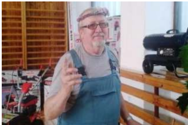
HOBBY A ZAHRADA 2015

vyslovím sv j obdiv všem t m šikovným rukám a chytrým hlavám, které se zde prezentovaly. Kdo se nebyl v p kném posvícenském víkendu podívat, ud lal chybu. Nahlédnout m žete ve fotogalerii internetových stránek ZO ZS Krakovany na adrese http://zoczskrakovany.txt.cz .