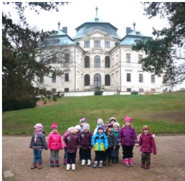
Zámek v Chlumci nad Cidlinou

D ěti poslouchají a jakoby p íroda cht ěla pohádce nahrát, za okny se rozchumelí. Nejprve jemn ě, pak k oknu d ěti vylákají velké sn ěhové vlo ky. Pohádka pokra uje. D ěde ek Rok si zavolal m sí ek „Prosinec“. Ten mu te ě bude pomáhat p ípravit se na nejkrásn ější svátky. Na jaké? D ěti se hlásí, vyk íkují jeden p es druhého. „No p eci na Vánoce, bude chodit Ježíšek!“ „Paní u ítelko, ale ekat na Ježíška bude dlouhé“, rozumují n které d ěti. To je pravda.