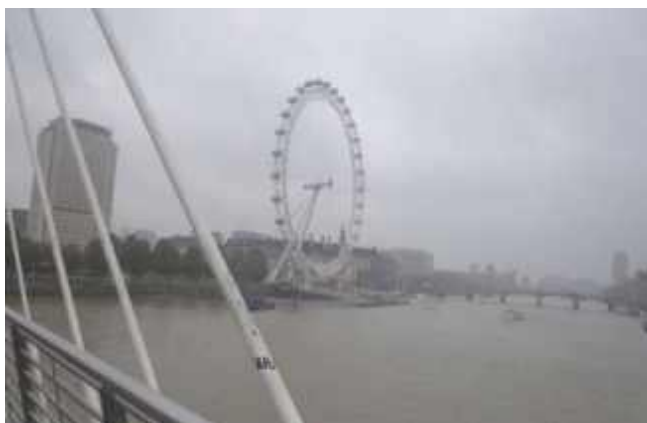
Výlet do Londýna

Další den jsme se šli podívat po Londýně. Viděli jsme Big Ben, London eye, Buckingham palace i se zahradou. Královna byla doma, byl tam na návštěvě čínský prezident. Večer jsme se v hotelu navečeřeli. Poslední den jsme navštívili Tower of London. Celé jsme si to tam prošli a nafotili. Po prohlídce jsme se šli podívat na Tower Bridge. Poté, co jsme si ho nafotili, jsme ho celý přešli. Procházeli jsme se podél řeky Temže. Zeptala jsem se, jaká je největší ryba v řece. Pan průvodce ale řekl, že největší ryba nebyla ryba, ale velryba. Připlavala k Big Benu a uvízla na mělčině. Několika loděmi jí dostali zpět do vody. Poté jsme si sedli do autobusu, chvíli jsme jeli a poté jsme nastoupili na trajekt. Tam jsme nakoupili různé suvenýry. Na pobřeží na nás čekal autobus a odvezl nás zpět do České republiky.