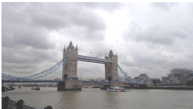
Výlet do Londýna