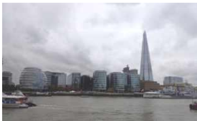
Zájezd do Londýna

Paní ředitelka se zeptala dětí z pátého ročníku, jestli by chtěly jet do Londýna. Všechny děti chtěly jet. Odjeli jsme 19. října. Cesta byla dlouhá, ale v autobuse byla zábava. Ráno jsme nastoupili na trajekt. Poté jsme šli do hotelu a měli jsme pět hodin s anglickým rodilým mluvčím. Večer jsme se ubytovali.