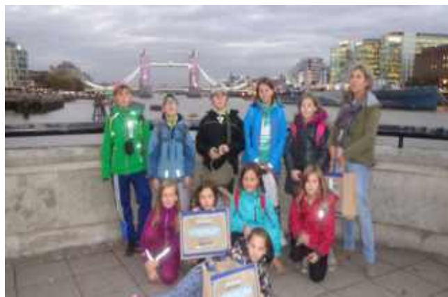
Zájezd do Londýna