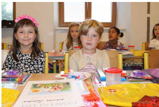
Zahájení školního roku