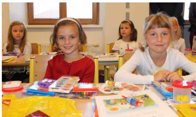
Zahájení školního roku

Kromě dětí z mateřské školy, žáků ze základní školy a zaměstnanců se obědy dovážejí ostatním strávníkům z Krakovany.