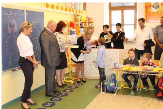
Zahájení školního roku

Během letních prázdnin bylo vymalováno přízemí mateřské školy, do třídy a herny v přízemí byl pořízen nový nábytek na uložení hraček a stavebnic pro děti.