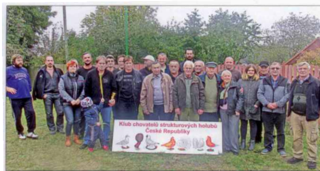
Společné foto účastníků přehlídky výletků strukturových holubů