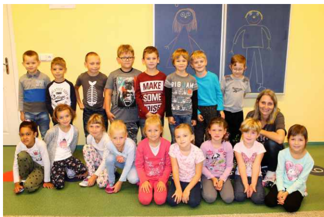
Zahájení školního roku