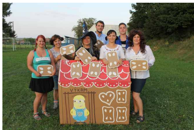
Loučení s prázdninami

Závod proběhl za krásného počasí dle platných směrnic Polabské ligy a hlavně bez komplikací a úrazů. Celkem se zúčastnilo hasičského klání 18 závodních družstev v následujících kategoriích: mladší děti, starší děti, muži a ženy. Velice úspěšný den měla výprava z Plaňan, která brala první místo v kategorii starší děti, ženy i muži. Jediné vítězství jim vzalo družstvo mladších dětí z Rasoch. Vítězům gratulujeme. Úspěšné bylo i družstvo Krakovany muži A, které si při druhém útku zlepšilo osobní rekord na čas 30,68s.