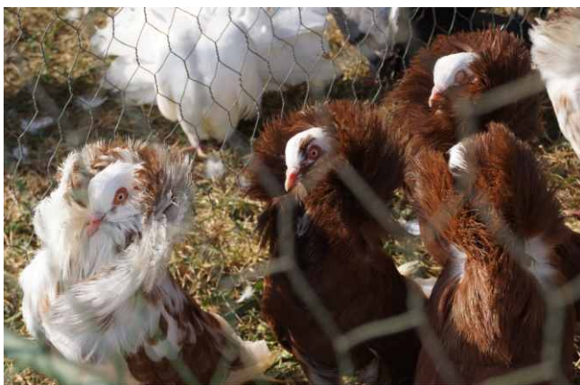
Výstava chovatelů 2016

Je to již tradice a těm co žijí tímto koníčkem patří i jeden článek v tomto vydání. Je to výběr z článku z časopisu SVĚT HOLUBU, č2/2017, který chválí naše chovatelé. Kdo by chtěl přečíst celý článek, dorazte k nám na obecnák a půjčíme vám tento časopis. Máme pouze jedno vydání.