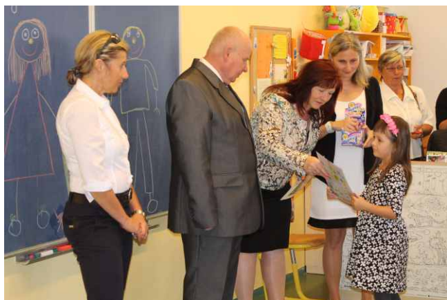
Zahájení školního roku

Provoz školní družiny je od 11.10 – 16.00 hodin.