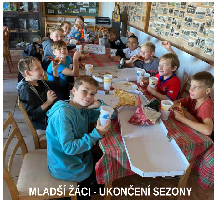
MLADŠÍ ŽÁCI - UKONČENÍ SEZONY

Tak a konečně k fotbalu. Do jarní přípravy naše družstva vletla s velkým nadšením. Konec zimy jsme odtrenovali v obecní tělocvičně, za což obci děkuji. Je našim důležitým podporovatelem.