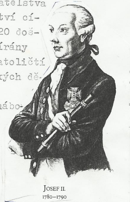
JOSEF II. 1780-1790