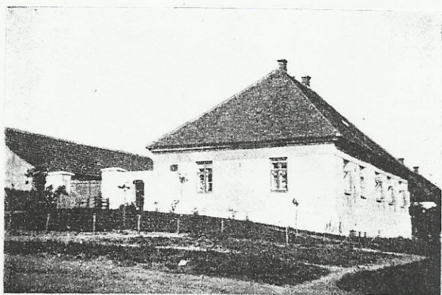
Farní budova č. 59.