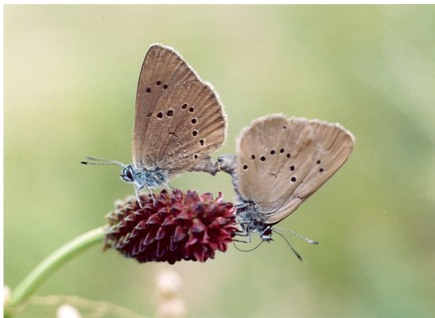
Párek motýlů modráška bahenního – Maculinea nausithous při kopulaci.

Modrásci bahenní, latinsky Maculinea nausithous (Bergsträsser, 1775) (Lepidoptera: Lycaenidae) jsou menší motýlci, kteří se vyskytují na vlhkých lukách. Spodní strana křídel je hnědá u obou pohlaví, svrchní je hnědá jen u samic, modrá s černou kresbou pak u samečků. Od podobného druhu modráška očkovaného – Maculinea telejus (Bergsträsser, 1775) je odlišíme podle jediné řady teček podél okraje na spodní straně zadního páru křídel. Modrásek očkovaný má totiž řady skvrnek dvě.