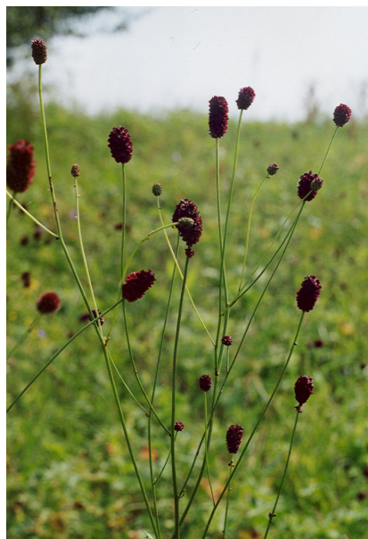
Živná rostlina modráška bahenního krvavec toten – Sanguisorba officinalis .

Modrásci bahenní jsou závislí na přítomnosti živné rostliny krvavce totenu - Sanguisorba officinalis (Linnaeus, 1758) a určitých druhů mravenců u kterých jeho housenky parazitují. Malé housenky po vylíhnutí z vajíčka vyžirají květní strbouly krvavců a po určité době vypadávají na zem, kde jsou během krátkého adoptního obřadu trvajícího asi 4 – 6 minut adoptovány mravenci. Housenky lákají mravence na sladké výměšky z dorzálních žláz a rovněž svým vzhledem napodobují mravenčí larvy. Jakmile jsou však zaneseny do mraveniště, nechovají se nijak přátelsky. V dostatečně početném mraveništi se nechávají částečně vykrmovat jako mravenčí larvy, většinou se ale samy larvy a kukly mravencům žerou. V mraveništích přečkávají zimu a po přezimování se kuklí, aby v červnu až v červenci ze země vylezl motýl, který po spáření založí další generaci. Hostitelskými mravenci pro modrásky M. nausithous jsou v našich podmínkách Myrmica rubra (Linnaeus, 1758) a zřejmě též M. scabrinodis