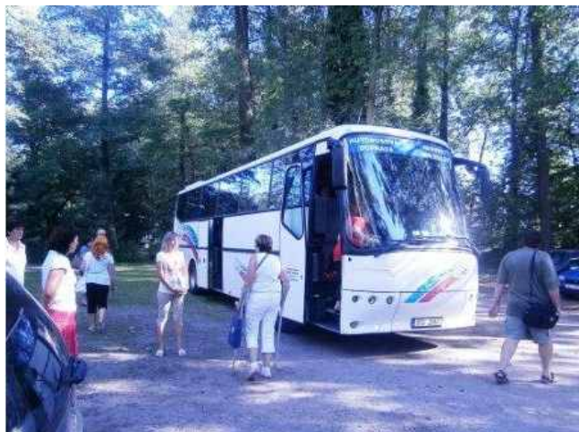
Zájezd - zahrádkáři