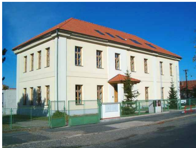
Základní škola Krakovany

ZÁHÁJENÍ NOVÉHO ŠKOLNÍHO ROKU 2015 / 2016