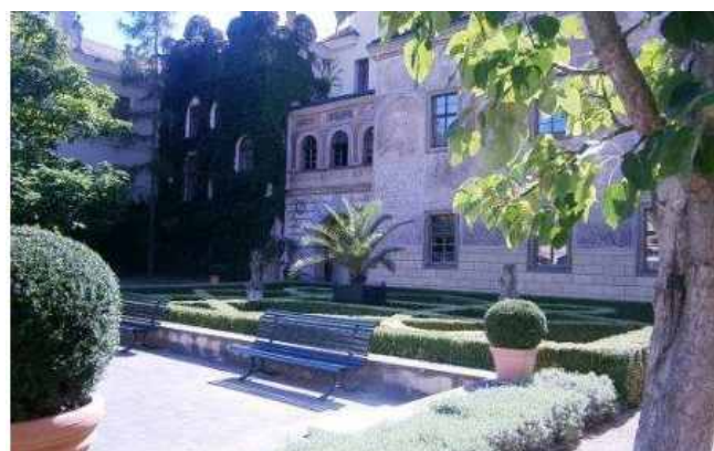
Zájezd - zahrádkáři