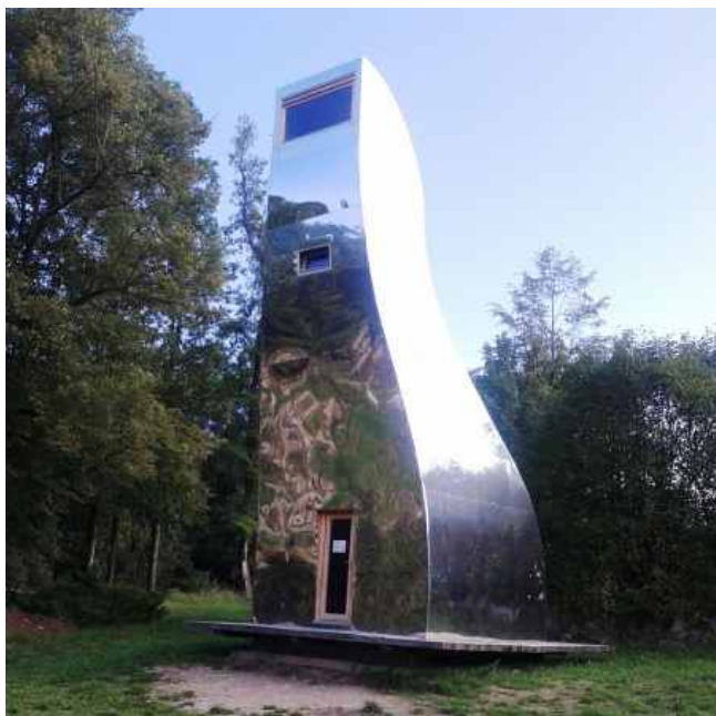
Zájezd - zahrádkáři