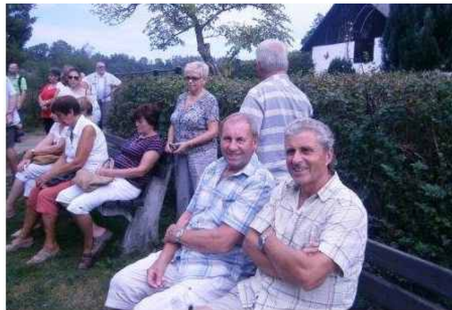
Zájezd - zahrádkáři

Škoda, že nebylo více času na anglický park, ten má ovšem rozlohu 42 ha. V parku žijí bílí daňci a jeleni Dubowského . U zámku leží minizvěřinec pro děti. V roce 2010 byl v zámeckém parku otevřen gloriet , sloužící k odpočinku návštěvníků parku.