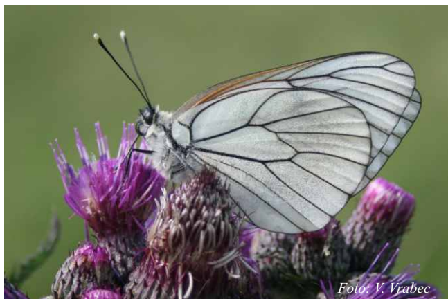
Obrázek 1: Odpočívající samec bělásek ovocného ( Aporia crataegi ) na pcháči ( Cirsium sp. ).

Zahrádkáři pozor, bělásek ovocný se vrací.